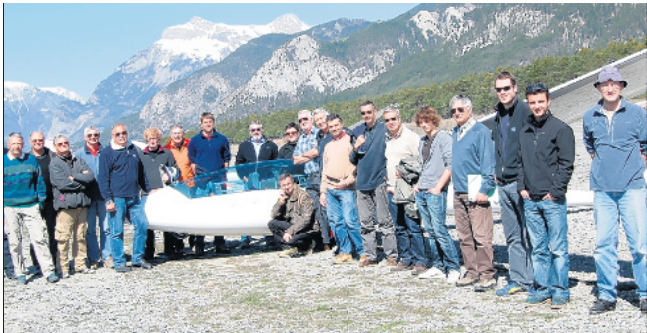
Chaque année de nouveaux pilotes viennent rejoindre les "habitués" du centre de vol à voile.

Le centre de vol à voile de Saint Pons vient de dresser un premier bilan depuis la reprise de la saison en mars. Et celle-ci commence un peu difficilement. Il est vrai que le "staff" du centre de vol à voile - moniteur, pilote remorqueur, secrétaire - ne ménage pas ses efforts pour fidéliser ses pratiquants. Mais s'il est un domaine où il ne peut vraiment rien, c'est la météo qui n'a pas été vraiment au rendez-vous en ce début de saison. A titre comparatif les pilotes avaient effectué pendant le mois de mars 2009 116 vols représentant 325 heures. Le bilan de mars 2010 vient de tomber avec 69 vols